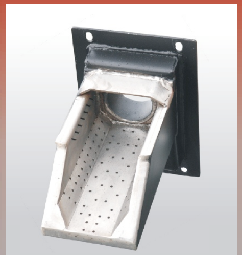
Palnik szufladowy, wykonany ze stali żaroodpornej do spalania biomasy, węgla i miału.